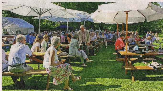
Im Jahr 2010 fand das zweite Kulturfest im Park des Bachmann-Museums statt.